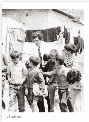
À l'occasion de la parution de Journal d'un maître d'école. Le film, un livre , sur une idée de Federico Rossin, paru aux éditions L'Arachnéen en juin 2019. www.editions-arachneen.fr

des opérations, à l'image du maestro qui renonce à sa position de maîtrise pour se voir inversement enseigné par le savoir et l'imprévisibilité des enfants-adolescents. La notion d'auteur est mise à mal; la capacité de réagir collectivement à l'événement devient la condition de la vérité du film. De Seta fonde son projet à la fois sur l'art de l'expérimentation et le principe de l'impureté (le mélange des types d'interprétation, du psychodrame et de l'improvisation documentaire) et sur la nécessité d'organiser en un récit accessible à tous le matériau « chaotique » issu du tournage.